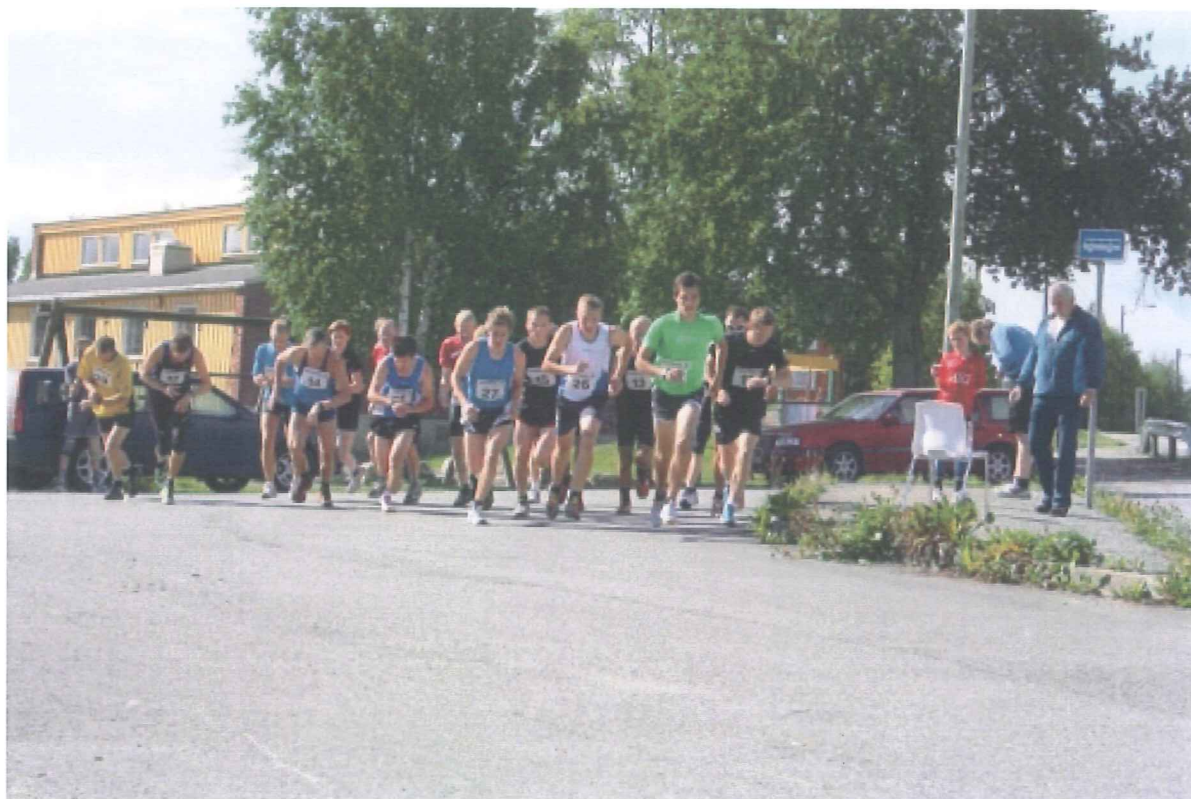
Fra Tittinghalla rundt!